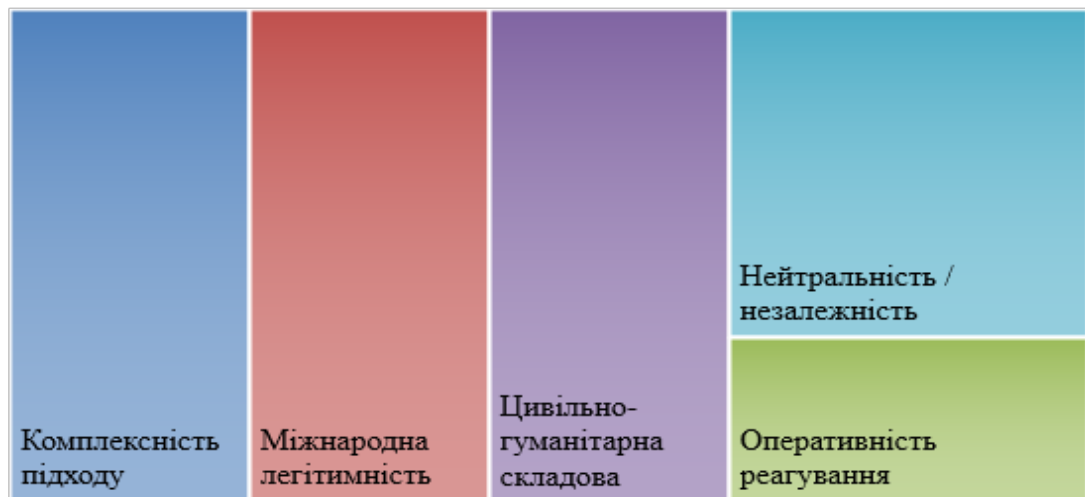
Рис. 3. Структура ключових компонентів постконфліктного регулювання: індексна візуалізація ефективності